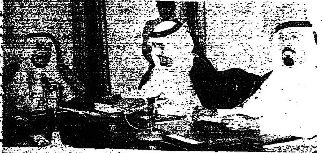
الملك خالد لدى ترؤسه اجتماع مجلس الوزراء الذي اقرت فيه الخطة الخمسية